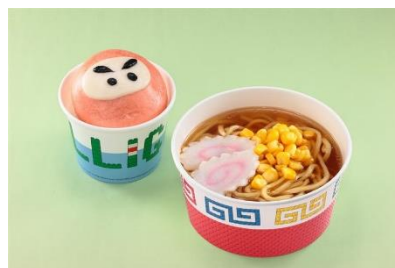
▲「ファクトリー・サンドウィッチ・カンパニー」で販売 キッズラーメンセット 豚まん付き／ニンジャドーナツ(3種類のフレーバー) 1,000円 各500円