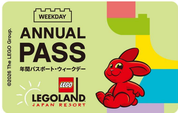
▲限定デザイン イメージ

LEGO, the LEGO logo, the Brick and Knob configurations, the Minifigure, NINJAGO, the NINJAGO logo and LEGOLAND are trademarks of the LEGO Group. ©2026 The LEGO Group. LEGOLAND is a part of Merlin Entertainments Ltd.