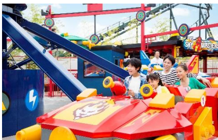
▲カイ・スカイ・マスター

ドラゴン型のライドで左右の翼を上手く操作し、360度ぐるぐる回転しながら自由に飛び回ろう！22mの高さを時速約50kmのスピードで回る、スリル満点のアトラクションです。