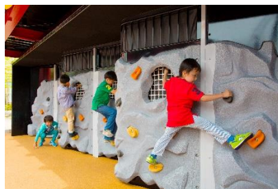
▲コーラル・ロッククライミング・ウォール

家族と一緒に空を飛び回る4人乗りのアトラクション。みんなで協力しながらライドを操縦し、周りの的を銃で狙ってポイントをゲット。チームワークで高得点をめざそう！