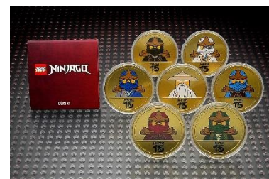
▲レゴ® ニンジャゴー 15周年記念コレクターズコイン イメージ

【レゴ® ニンジャゴー 15周年記念コレクターズコインをプレゼント】 実店舗での品揃え日本一の「ビッグ・ショップ」にて、レゴ® ニンジャゴー のボックスセットを含む1会計6,600円以上のお買上げで、レゴ® ニンジャゴー 15周年記念コレクターズコイン(非売品)を1枚プレゼントいたします。