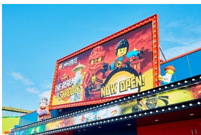
▲レゴ®ニンジャゴー・ライブ外観／内観 イメージ