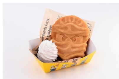
▲「アイス・ファクトリー」で販売 ニンジャワッフル 600円

(左：ニンジャ饅 700円 中：パワーアップ塩焼きそば エビマヨ／パワーアップチャーハン BBQビーフ 950円 右：ニンジャカステラ 5個入り) 500円