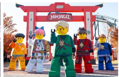
▲フォトセッション イメージ