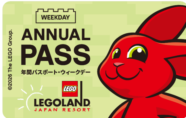
▲レギュラーデザイン イメージ