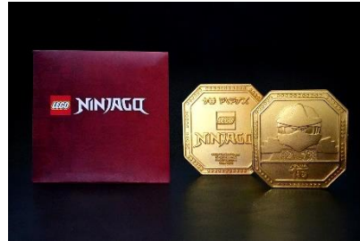
▲ニンジャの証メダル イメージ