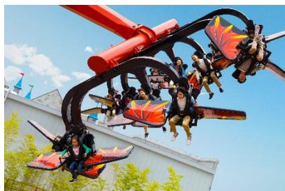
▲フライング・ニンジャゴー®

ドラゴン型のライドで左右の翼を上手く操作し、360度ぐるぐる回転しながら自由に飛び回ろう！22mの高さを時速約50kmのスピードで回る、スリル満点のアトラクションです。