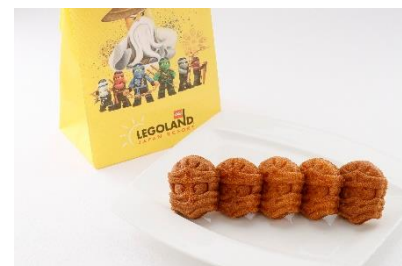
▲「ニンジャ・キッチン」で販売

(左：ニンジャ饅 700円 中：パワーアップ塩焼きそば エビマヨ／パワーアップチャーハン BBQビーフ 950円 右：ニンジャカステラ 5個入り) 500円