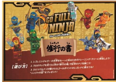
▲修行の書 イメージ