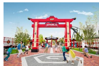
▲レゴランド®・ジャパン内 「レゴ® ニンジャゴー・ワールド」エリア

レゴランド®・ジャパンでは、2019年7月に誕生した「レゴ® ニンジャゴー・ワールド」エリアで、その世界観を体験することができます。また、2027年春には新たなアトラクションの導入を含んだエリアの拡張を予定しており、世界最大級の「レゴ® ニンジャゴー・ワールド」が誕生いたします。