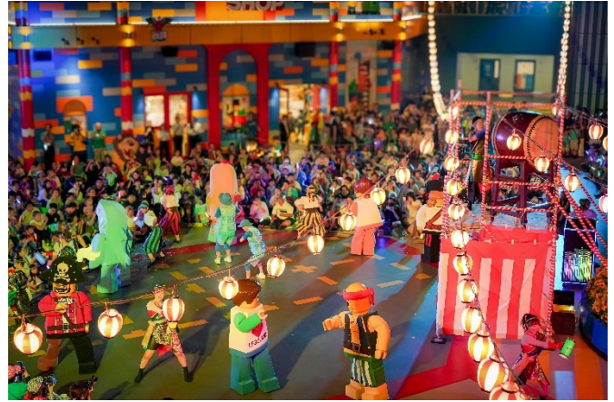
▲2025年開催時のまつりナイト・スペシャルショーイメージ