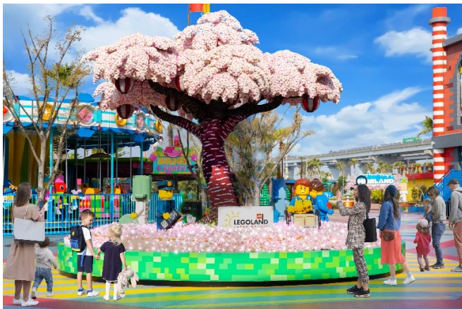
▲サクラツリー イメージ

そして、昨年大好評だった「お祝いシール」が桜の花びらをモチーフにした新たなデザインで登場。入学、進級、卒業など、新しい門出を迎える子どもたちに、スタッフからお祝いの言葉を添えてお渡しいたします。