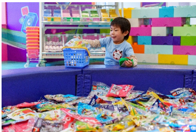
▲はじめてのおかいもの イメージ