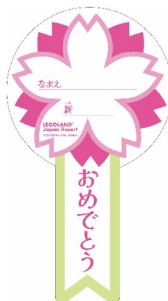
▲お祝いシール イメージ