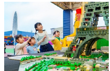
▲2025年実施時 イメージ

今年は、エッフェル塔(フランス)、ピサのドゥオモ広場(イタリア)、コロッセオ(イタリア)、ピラミッド(エジプト)、ヌビア像(エジプト)、長安門(韓国)の6点を展示いたします。