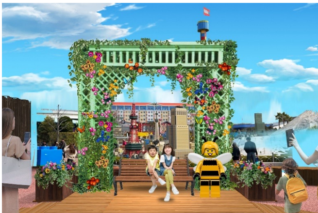
▲レゴ®フラワーガーデン フォトスポット イメージ