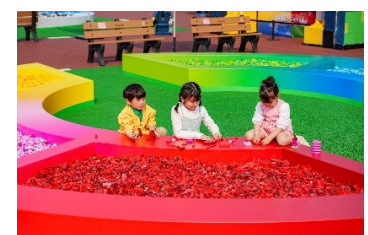
▲2025年実施時 イメージ

カラフルなレゴ®ブロックが敷き詰められた巨大なプール「ブリックサークル」に加え、小さなお子さまでも楽しめるようにレゴ®ブロックの2倍の大きさのレゴ®デュプロ®ブロックのプールがイベントエリア登場します。完成した作品はイベントエリア中央に設置された“イマジネーションステージ”に飾り、撮影してお楽しみいただけます。