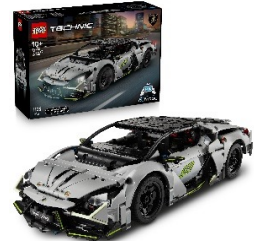
▲操作モデル 「42214 Lamborghini Revuelto スーパースポーツカー」

昨年人気だった「レゴ® テクニックシリーズ」の車をタブレット操縦して、デコボコした道乗り越える“でこぼこラッシュ！”が新たなステージになって登場します。今年は、サーキットで繰り広げられるスピード勝負に挑戦いただけます。スポーツカーには、それぞれレゴ®やレゴランド®にまつわる数字が隠されているので、是非チェックしてみてください。