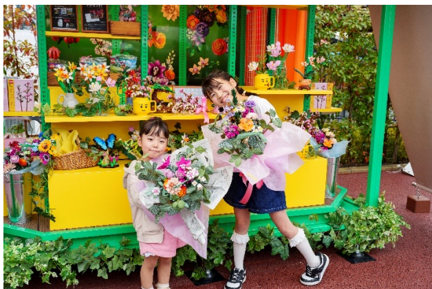
▲フラワーショップ イメージ