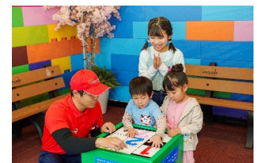
▲2025年実施時 イメージ

レゴ®ブロックでできたピースを動かして、1つのパズルを完成させる人気アクティビティ。未就学児のお子さまから大人まで楽しむことができ、パズルの種類は“やさしい／ふつ／むずかしい”の3つの難易度から選択できます。