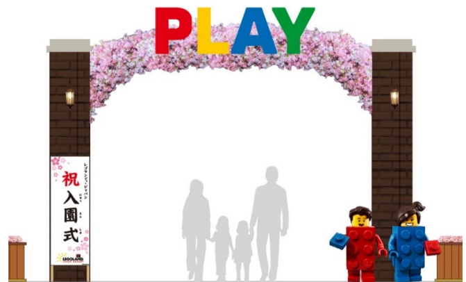
▲イベントエリア入口ゲート イメージ