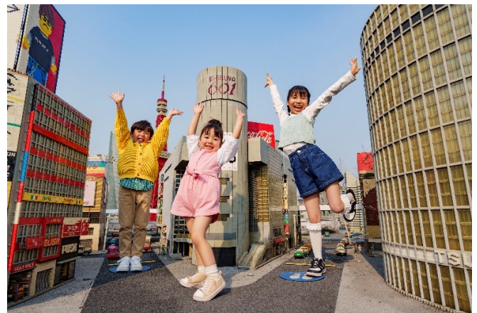
▲2025年実施時 イメージ(東京・渋谷)

普段は入ることができない「ミニランド」の柵内に、期間中限定で入ることができ、今年は東京・渋谷に加え、新たにお台場エリアが新スポットとして登場いたします。