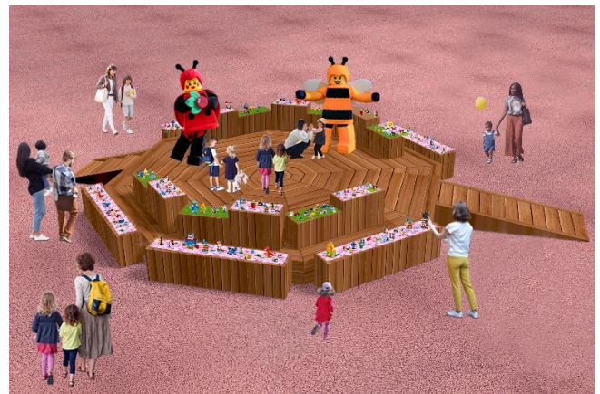
▲イマジネーションステージ イメージ