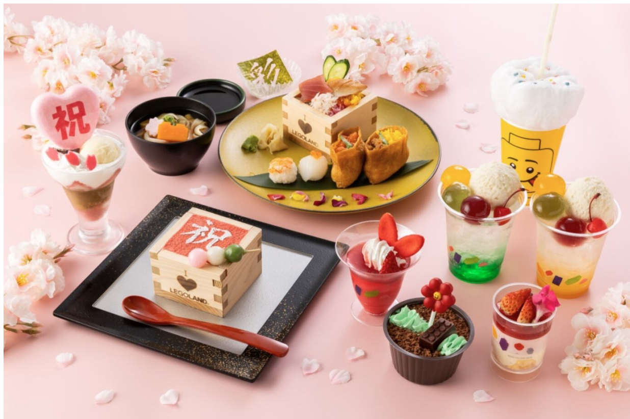
▲春の限定グルメやスイーツ イメージ(画像右下：ファクトリー・サンドウィッチ・カンパニー/画像左：彩 和食レストラン/画像右上：限定ドリンク)