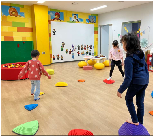
学童保育専用ルーム